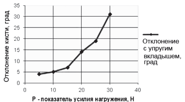
Рисунок 2. График изменения отклонений кисти от номинального положения с упругим вкладышем Figure 2. Graph of changes in the deviations of the hand from the nominal position with an elastic insert

продольное нагружение соответствует усилиям на приводной тяге искусственной кисти. В качестве предельного значения нагрузки был принят порог усилий на раскрытие пальцев. Открывание пальцев тяговой кисти происходит с усилием 70 Н.