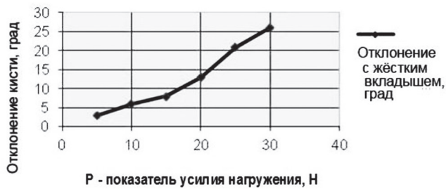
Рисунок 3. График изменения отклонений кисти от номинального положения с жёстким вкладышем Figure 3. Graph of changes in the deviations of the hand from the nominal position with a rigid insert

Зависимости угла поворота искусственной кисти от внешней нагрузки в продольном направлении при использовании упругого и жёсткого вкладышей представлены в виде графиков (рисунок 4).