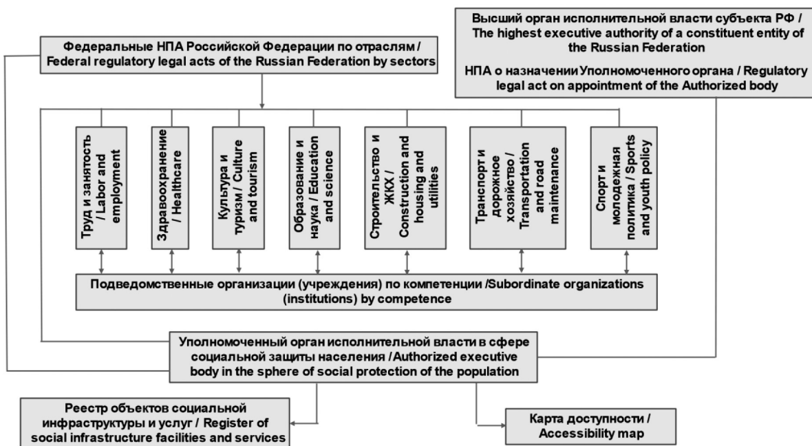
Рисунок 2. Организационная модель управления доступной средой в субъектах Российской Федерации с ведомственным (отраслевым) подходом

Применение «ведомственного (отраслевого) подхода» заключается в том, что после принятия федеральных нормативных правовых актов в отраслевой сфере (образование, здравоохранение, физическая культура и спорт, культура и туризм) субъектами Российской Федерации принимаются аналогичные документы, которые расширяют правовые нормы федерального уровня, за исключением сферы здравоохранения, где применяются нормативные правовые документы федерального уровня (рис. 2).